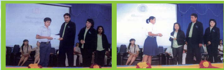
วิทยาลัยการอาชีพพรหมคีรี