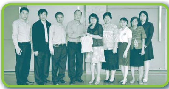
ประหยดอดอม เอื้ออารีซังกับเสกกัน

สอ.ข้าราชการกรมวิเทศสหการ จก. เยี่ยมชมงาน วันพฤหัสบดีที่ 23 พฤษภาคม 2556