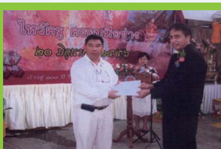
วิทยาลัยศิลปหัตถกรรมนครศรีธรรมราช