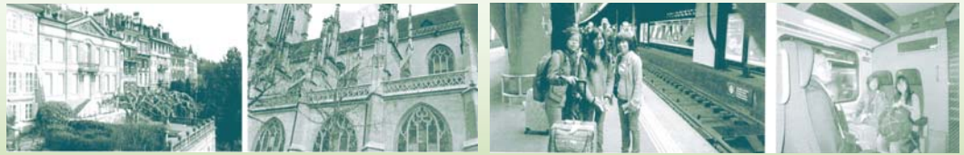
เที่ยวกรุงBern และบริเวณเมืองเก่า Zytglogge and fountains

ฟังแล้วก็อดยิ้มด้วยความชื่นใจไม่ได้ นะคะ เอาเป็นว่าหากมีโอกาสดี ๆ แบบนี้อีก เราจะเก็บภาพและความประทับใจนี้มาฝากสมาชิกทุกท่านแน่นอนคะ