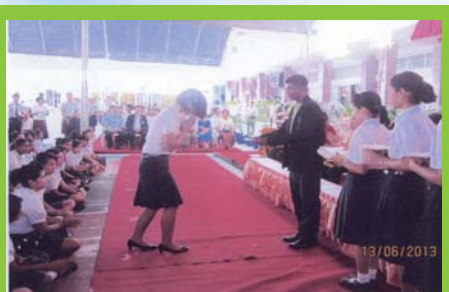
วิทยาลัยการอาชีวศึกษานครศรีธรรมราช