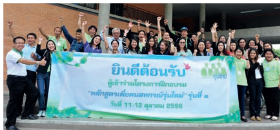
ถ่ายภาพร่วมกัน ณ สหกรณ์ออมทรัพย์กรมป่าไม้ จำกัด ก่อนการทำกิจกรรมบำเพ็ญประโยชน์นอกสถานที่