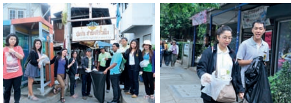
ผู้เข้าร่วมฝึกอบรม พร้อมคณะกรรมการและเจ้าหน้าที่ สอ.ปม. ร่วมกันทำกิจกรรมบำเพ็ญประโยชน์โดยการเดินเก็บขยะตลอดเส้นทางจากสอ.ปม. ไปยังชุมชนบางบัว เขตบางเขน และร่วมกันเก็บกวาดทำความสะอาดบริเวณศูนย์เรียนรู้บ้านมั่นคง ชุมชนบางบัว