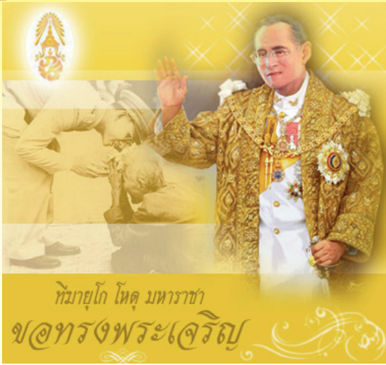
ทศบาล โทศ มหาราช ขอทรงพระเจริญ