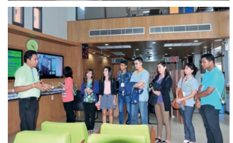
ภายหลังจากการบำเพ็ญประโยชน์ ผู้เข้าร่วมอบรมได้เรียนรู้การดำเนินงานของสหกรณ์ออมทรัพย์กรมป่าไม้ จำกัด