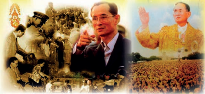
: คนหลังเลนส์

“คุณรู้ไหมทำไมคนต่างชาติหลาย ๆ ประเทศถึงตัดสินใจมาลงทุนที่เมืองไทย” ส่วนมากแล้วจะประเมินกันว่าแรงงานประเภทงานฝีมือคนไทยมีศักยภาพสูงสุดในแถบเอเชีย สูงกว่าญี่ปุ่นเสียอีก ตอนนี้จะพอมีใช้ได้ก็เวียดนาม แต่ไม่กระตือรือร้นเท่าที่ควร จึงยังห่าง...แต่นั้นไม่ใช่เหตุผลหลักนะค่ะ เพราะสิ่งที่ชาวต่างชาติคิดอยู่เสมอ นั่นก็คือ ปัจจัยหลักที่พวกเขาตัดสินใจมาลงทุนที่เมืองไทยเป็นเพราะ “ในหลวงฯ”..